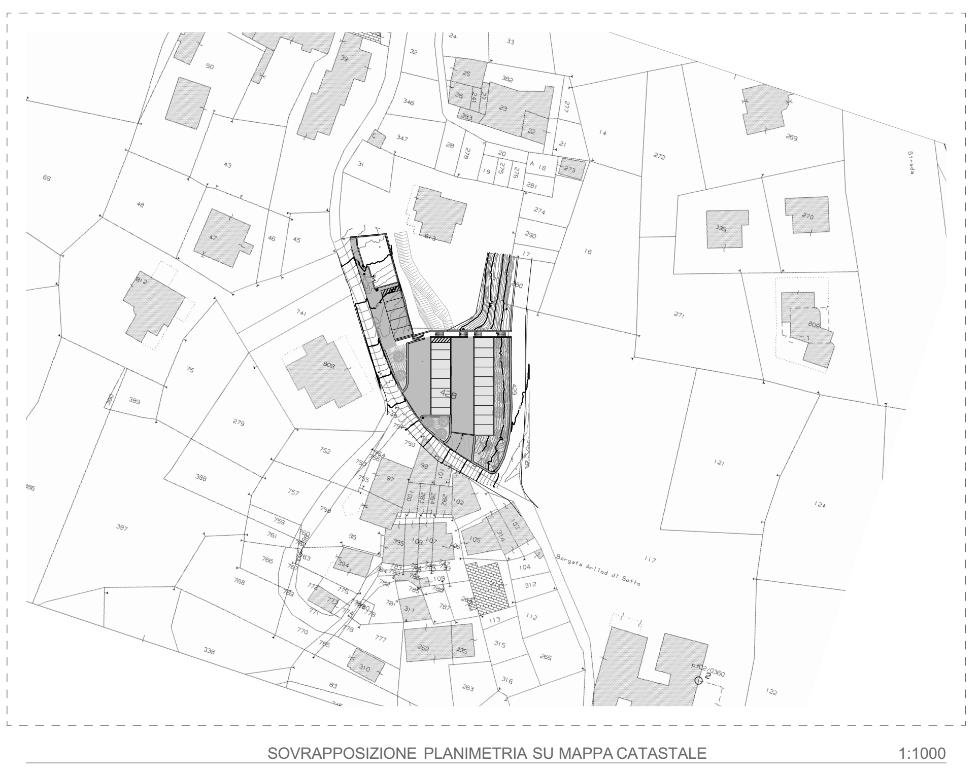
SOVRAPPORZIONE PLANIMETRIA SU MAPPA CATASTALE 1:1000