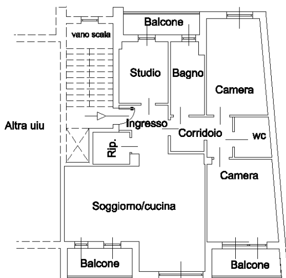
PIANO SECONDO H 2.70 mt